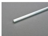
33912 Verlängerungsachse 290 mm lang