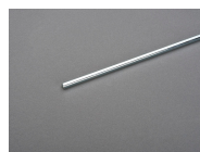
33913 Verlängerungsachse 490 mm lang